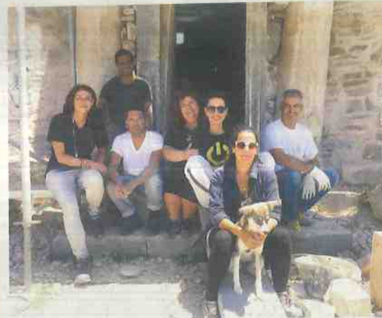
Η ομάδα συντηρητών και αρχιτεκτόνων που εργάστηκε για την αποκατάσταση του μνημείου.