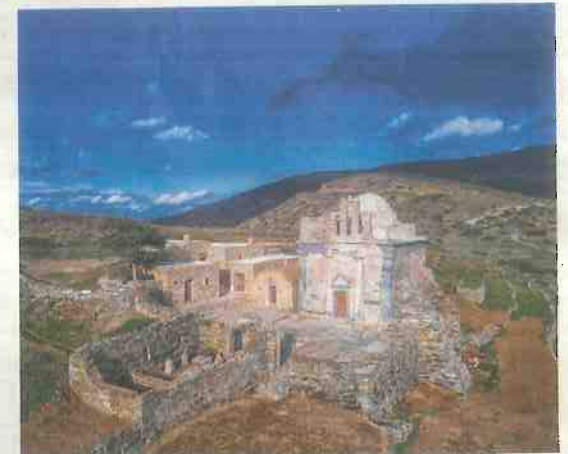
Η αποκατεστημένη πια και βραβευμένη διεθνώς Επισκοπή, η ιστορία της οποίας θα ακουστεί στο Λονδίνο.