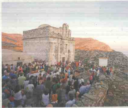
Η Επισκοπή προτού αποκατασταθεί, με κόσμο που εόρταζε τον Δεκαπενταύγουστο στην αυλή της.