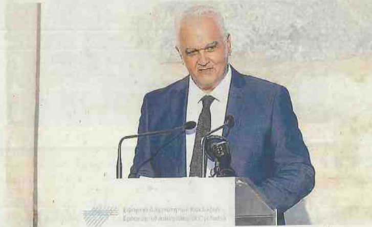
Ο βυζαντινολόγος δρ Δημήτριος Αθανασούλης, έφορος Αρχαιοτήτων Κυκλάδων και Δωδεκανήσου.

Η θέση των οστών, ορισμένα ευρήματα που παραπέμπουν σε ξόρκια της αρχαιότητας και τα κτερίσματα της έχουν προκαλέσει το μεγάλο ενδιαφέρον των ειδικών, καθώς μέχρι τώρα μένουν πολλά αναπάντητα ερωτήματα όχι μόνο για την ταυτότητά της αλλά και τον τρόπο του θανάτου της. Οσο όμως περιμένουμε κάποια αρχικά συμπεράσματα, μέσα από τη διάλεξη του Δημήτρη Αθανασούλη θα ξεδιπλωθεί όλη