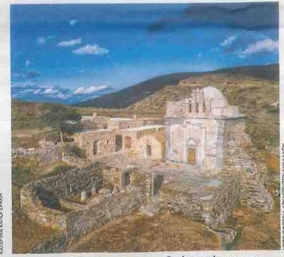
Η Επισκοπή Σικίνου , ένα μοναδικό παγκόσμιο μνημείο, που βρίσκεται στις Κυκλάδες.